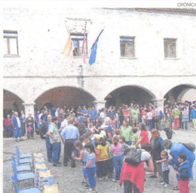
Los vecinos de Ejulve son muy participativos.

-Proporcionar instrumentos de información y participación adecuados y accesibles, que posibiliten compartir valores y prácticas democráticas.